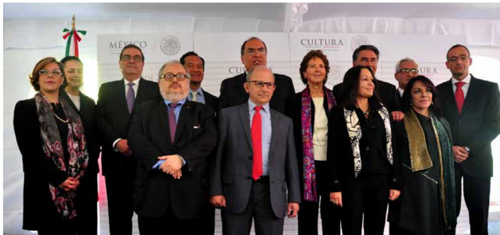
García Cepeda (centro) y su equipo. El presidente Peña Nieto designó a los dos subsecretarios, al titular del Instituto Nacional de Lenguas Indígenas y al Oficial Mayor de la dependencia.

Durante el evento, García Cepeda reiteró su compromiso de proteger el patrimonio cultural, apoyar el talento y quehacer artístico, respetar la libertad de expresión y creación, impulsar la educación artística "de calidad como uno de los pilares del desarrollo cultural" y hacer llegar los beneficios del arte y la cultura al mayor número de mexicanos. "Daremos prioridad a las acciones que refuercen el papel de los servicios públicos del sector en apoyo a la economía familiar como un conjunto de bienes y servicios, en gran parte gratuitos, de bajo costo o con descuento, que están estrechamente asociados con la calidad de vida; particularmente los destinados a niños y jóvenes, en los que subrayaremos el estrecho vínculo entre educación y cultura", enfatizó.